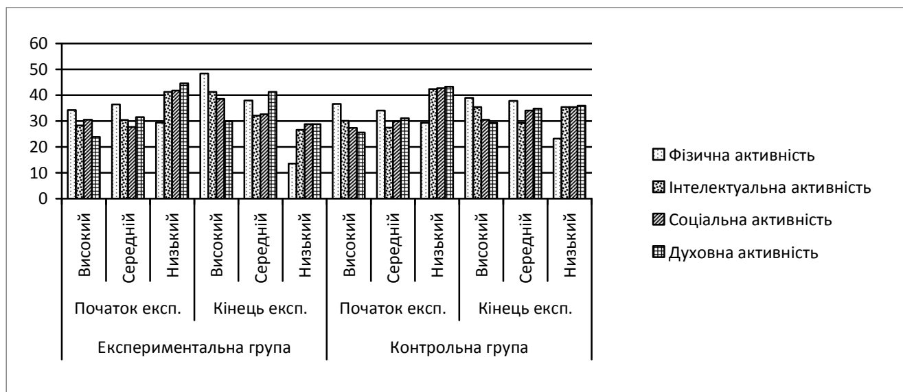
Рис. 2. Динаміка рівнів сформованості особистісної активності підлітків експериментальної та контрольної груп за результатами констатувального та формувального етапів експерименту

Отже, позитивна динаміка показників фізичної, інтелектуальної, соціальної та духовної активності підлітків, яка забезпечувалася реалізацією комплексу обґрунтованих педагогічних умов, дає підстави стверджувати, що висунута нами гіпотеза підтверджена.